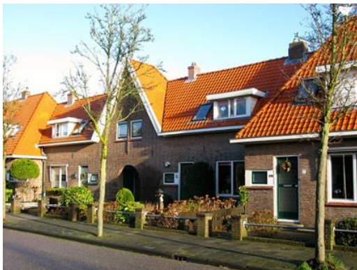
Figuur 4 (Monumentaal, 2014)