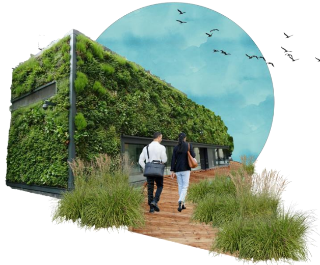
Figuur 5 Sfeerimpressie buffer

Wij zullen op een aantal plekken die door bewoners als bijzondere knelpunten zijn aangeven natuurlijke buffers plaatsen om niet alleen de geluidsoverlast dat zij ervaren te verminderen, maar ook visueel de industrie te verhullen, zie afbeelding 5 voor sfeerimpressie en de Ontwikkelingskaart voor locatie.