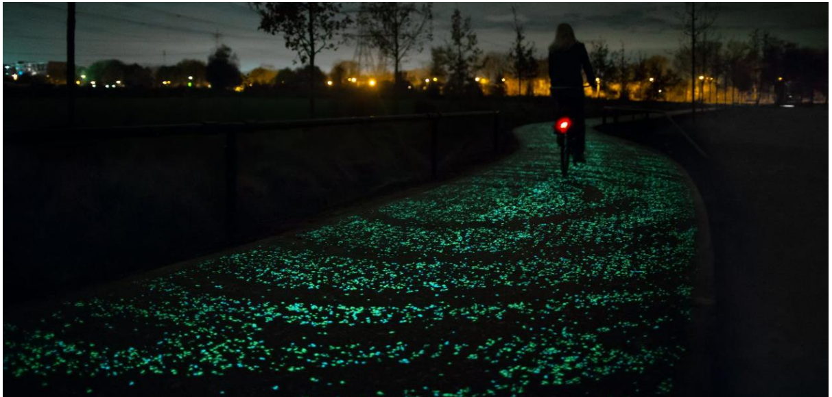
Figuur 7 (thisiseindhoven, z.d.)

Zoals genoemd in de Gebiedsanalyse is de afname van de invloed van de bloemenveiling nog altijd voelbaar in het gebied. Om deze terug te brengen en hiermee de dorpsidentiteit te versterken, zullen verschillende toeristische attracties die zich bezighouden met bloementeelt en bloemenveiling aangestipt worden en verbonden worden met een fietspad. Dit Bloemenfietspad loopt door heel Aalsmeer en verbindt de oude bloemenveiling cultuur weer met het dorp.