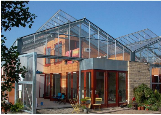
Figuur 2 (hetkanwel, 2016)