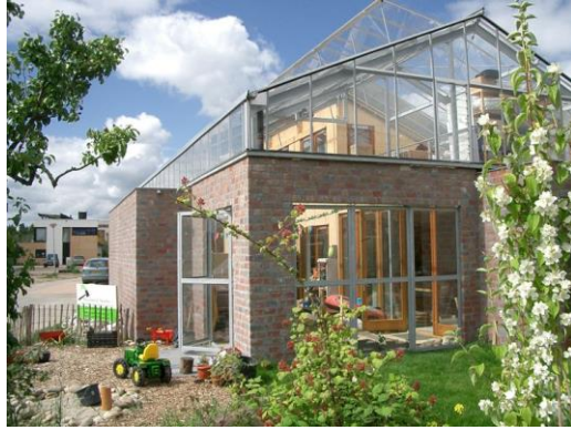
Figuur 1 (vanhavertotgort, z.d.)