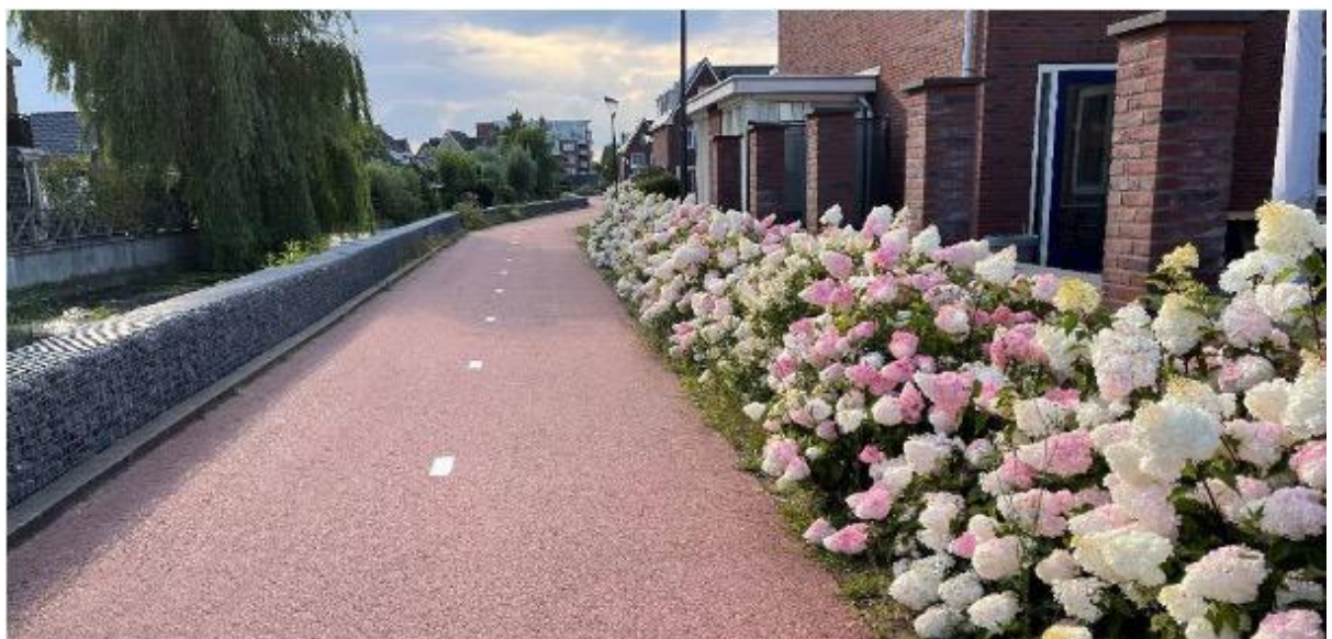
Figuur 8 (Nieuw Volendam, 2021)