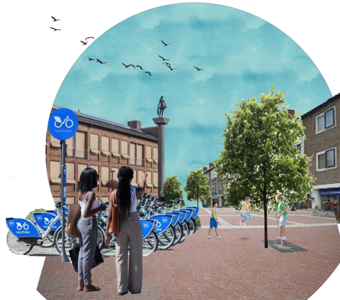
Figuur 6 Sfeerimpressie nieuw Raadhuisplein

De verbinding tussen het openbaar vervoer en de fiets wordt verbeterd door het aanleggen van een fietsparkeerplaats bij de nieuwe bushalte, dit is weergegeven in de Detailkaart. Hier worden ook gedeelde fietsen aangeboden. Op het Raadhuisplein in Aalsmeer komt de tweede fietsparkeerplaats, wederom met gedeelde fietsen. Zo wordt het makkelijk voor zowel toeristen als bewoners om de bus te combineren met de fiets en duurzame vervoersmiddelen te kiezen. Een visualisatie van het Raadhuisplein met de gedeelde fietsen parkeerplaats is te zien in afbeelding 6.