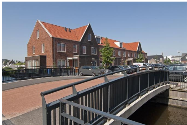
Figuur 3 (Timpaan, z.d.)

Zoals beschreven staat in de Gebiedsanalyse van dit document, hebben bewoners regelmatig laten weten zich ingesloten te voelen door bedrijven en distributiecentra rondom de woonkernen. Zelf noemden zij als oplossing het aanleggen van buffers (dorpsraad Rijsenhout, persoonlijke communicatie, 2023).